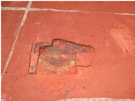
Voor de reparatie