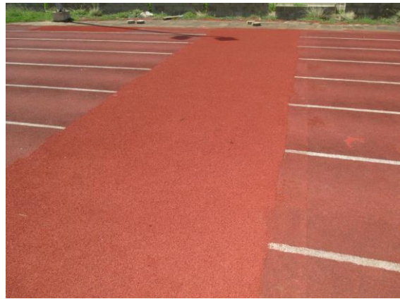
Na de reparatie